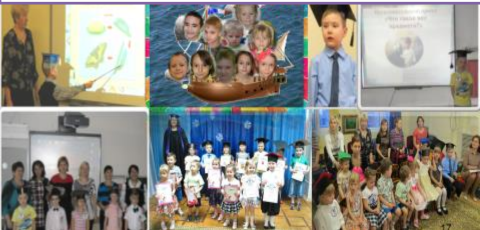
Научное общество обучающихся «Почемучки» МАДОУ ДС №10 «Белочка» и научное общество учащихся «Спектр» МБОУ «СШ №15»